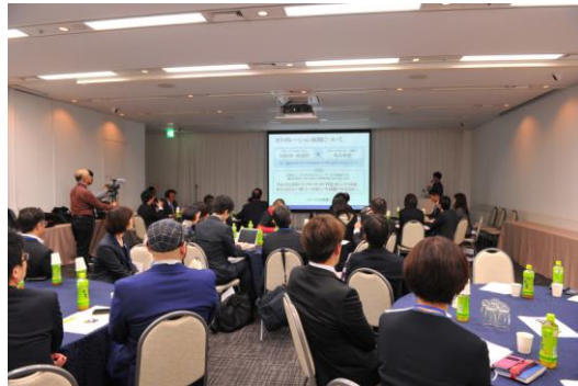
受講終了後には、ビジネス発表会や懇親会も開催 (写真は過去の会場の様子)